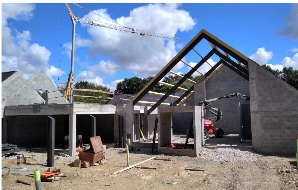
Le chantier en cours du futur Musée de la Résistance en Bretagne, à Saint-Marcel

Certains ont pu s'impatienter d'entendre depuis longtemps parler de ce nouveau musée sans voir le début des travaux, mais la rénovation d'un Musée de France s'inscrit dans le temps long. Il faut en premier lieu une volonté politique forte et une tutelle solide. C'est désormais le cas puisque la maîtrise d'ouvrage du projet est assurée par de l'Oust à Brocéliande Communauté, collectivité regroupant 26 communes et fédérant 40 000 habitants, dont les élus sont convaincus du potentiel exceptionnel de ce musée, de l'importance des valeurs qu'il porte et de l'intérêt de ses collections. Il faut encore réunir des conditions nombreuses et exigeantes pour qu'un tel projet apparaisse comme sérieux et crédible et soit éligible à d'importantes subventions publiques. C'est aujourd'hui le cas grâce au soutien financier conséquent de l'Etat (Ministère de la Culture et des Armées), de la Région Bretagne et du département du Morbihan, complété par la contribution de généreux mécènes : plus de 4 millions d'euros ont été réunis.