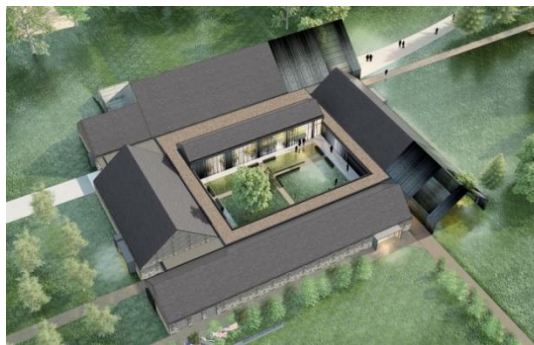
Vue du projet du futur musée de la Résistance en Bretagne

Mais il ne s'agit pas d'une fermeture définitive, un moment redoutée. C'est une renaissance dont il s'agit. Que de chemin parcouru depuis l'« appel au secours » lancé par les municipalités de Saint-Marcel et Malestroit en 2013 pour sauver ce musée, message entendu jusqu'au plus haut sommet de l'Etat et dans ses services déconcentrés au premier rang desquels la DRAC Bretagne, qui a tout mis en œuvre pour organiser ce « sauvetage ». Forts de ce soutien, les élus et l'équipe en charge de ce dossier au sein de la CCVOL puis de l'Oust à Brocéliande Communauté travaillent donc depuis plus de 6 ans à sauver ce lieu emblématique.